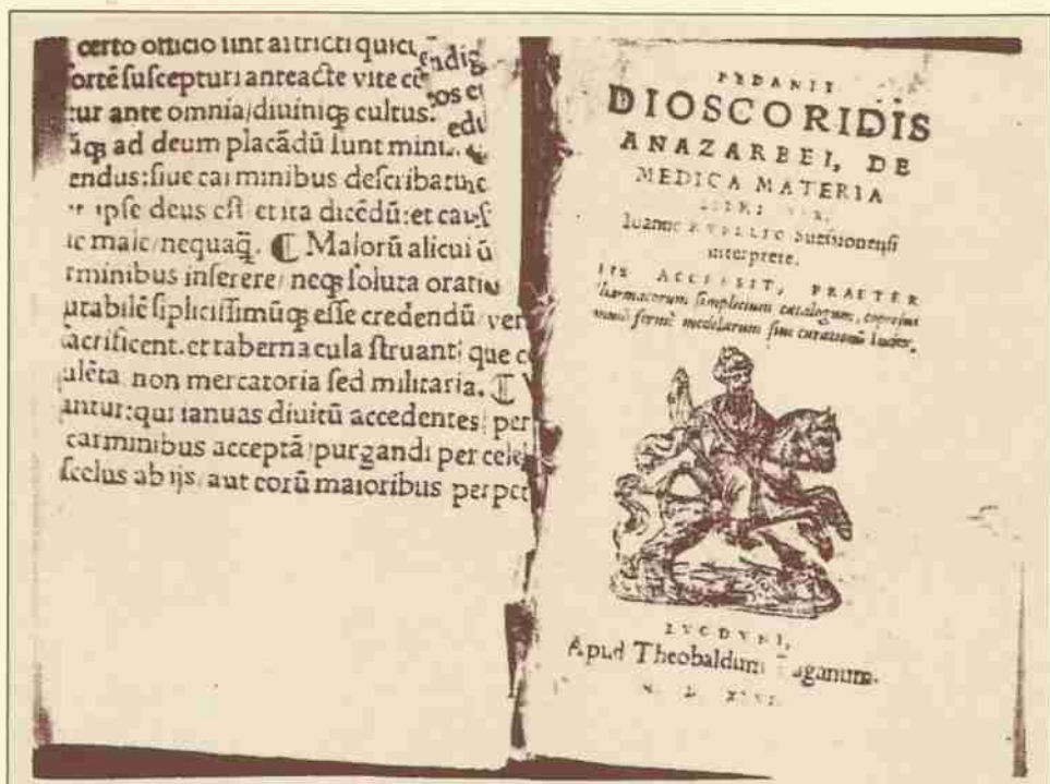
EL DIOSCÓRIDES DE SESMA